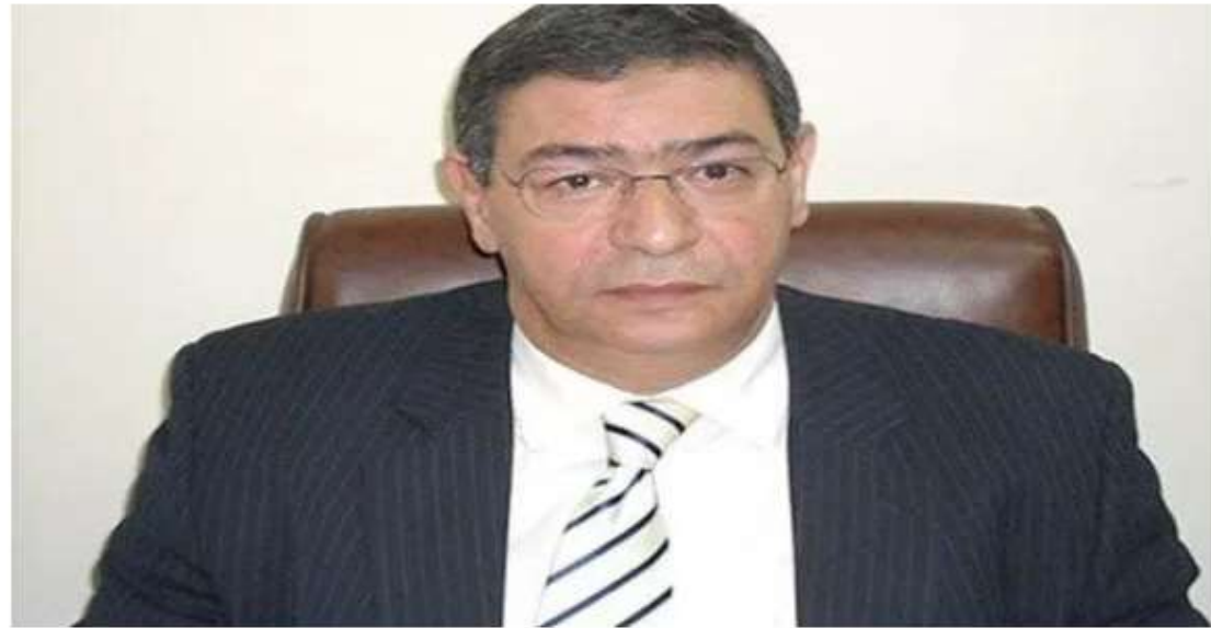
3 شركات ناشئة تحصد جوائز مسابقة "الابتكار" من شعبة الاقتصاد الرقمي